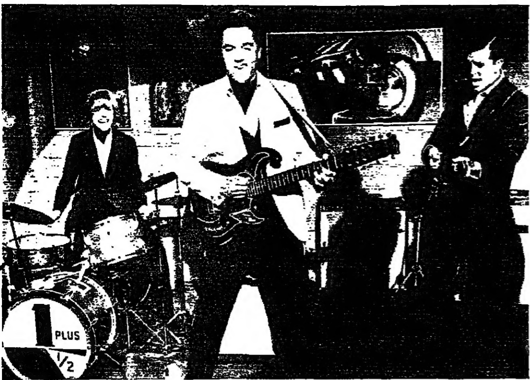
الريس بريسل في اوج شهرته